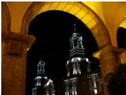
Arequipa PLaza de Armas

La Ruta del Sillar es un recorrido de historia, cultura viva y aventura. Descubrimos porque a Arequipa se le conoce también con el nombre de "La ciudad blanca", desde cuando en Arequipa venimos utilizando el Sillar como material de construcción para las casas, iglesias y casonas. Situado entre impresionantes paisajes, en las canteras del Sillar veremos cómo es la extracción de esta piedra denominada Ignimbrita, como se forman los sillares y conoceremos a uno de los canteros que trabajan día a día y llevan una tradición que va de generación en generación.