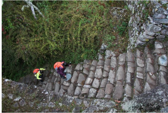
Camino del Inca