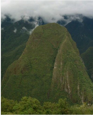
Huaynapichu Autor:Nuria Casaponsa

Reserva sujeta a disponibilidad. El importe pagado no es reembolsable por cambio ni cancelación.