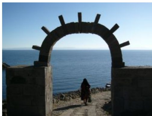
Llac Titicaca - Illa Amantani