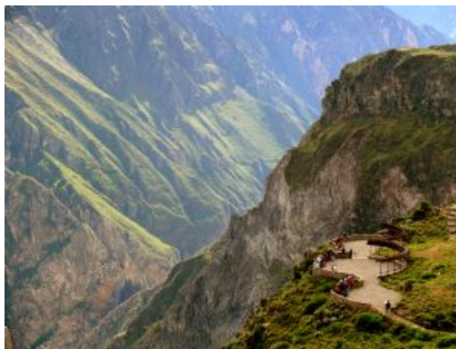
Valle del Colca