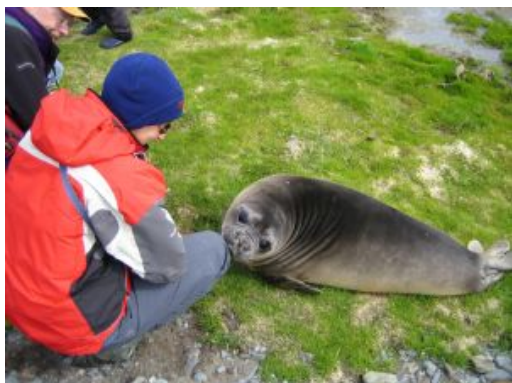
South Georgia 8