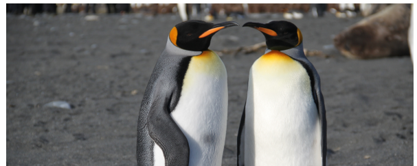
Autor: Antonio Ariza