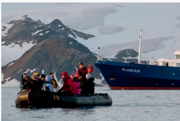
Excursión en zodiac

Un equipo de especialistas ofrece un completo programa de charlas sobre la exploración polar y el ecosistema ártico. Y también está a disposición del viajero para cualquier consulta o para ayudarle a identificar desde cubierta las aves marinas que navegan junto a nosotros. La política de "puente abierto" permite acompañar a los oficiales en el puente compartiendo el manejo del barco y la navegación