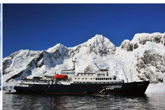
Autor:ANTARPLY M/V USHUAIA Barco Plancius