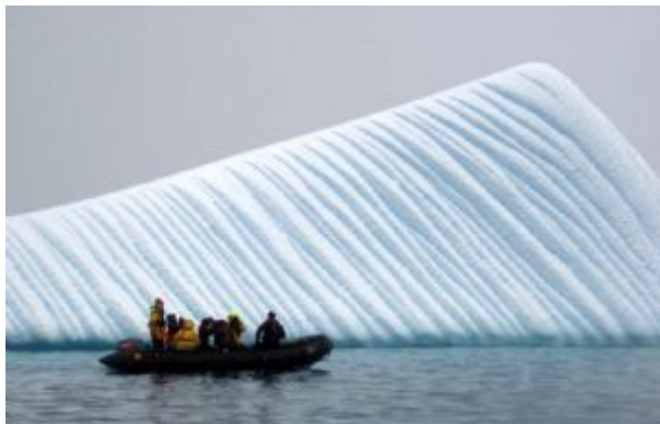
Ocean Nova 10

Emprendemos el viaje de regreso por el Pasaje de Drake. Unos días de travesía en compañía de albatros y disfrutando del recuerdo de las experiencias vividas los días anteriores. El Cabo de Hornos representa el final de la travesía oceánica y el encuentro con las resguardadas aguas del Canal de Beagle