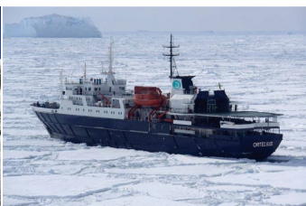
Autor:R. Van Poppelen Barco Ortelius 5