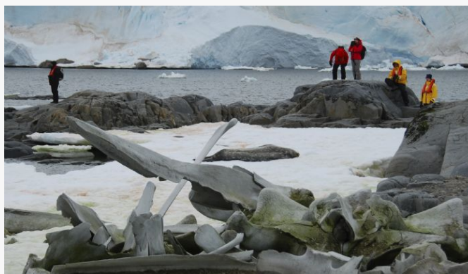
Huesos de ballena