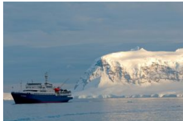
Barco Plancius Paisaje antártico