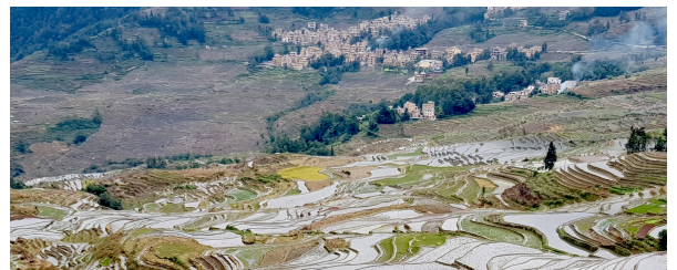
Autor: Joan Bartomeu