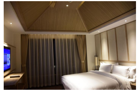
Hotel Oness Resort