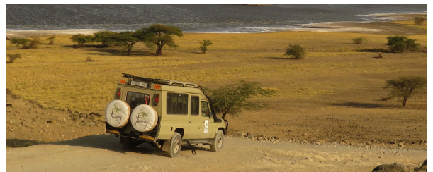
Autor: Jaume Pauné