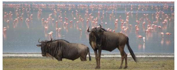
Autor: Jordi Rodriguez