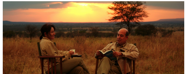
Autor: Oriol Mas Soler