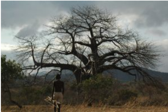
De caza junto al Lago Eyasi

Por la tarde saldremos del cráter y nos dirigiremos a la localidad de Karatu.