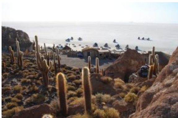
Salar de Uyuni