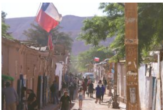
San Pedro de Atacama