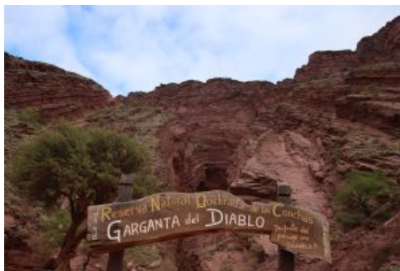
Quebrada de las Conchas