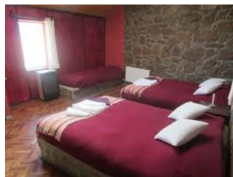
Hotel Tayka Desierto