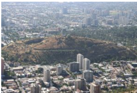
Santiago de Chile