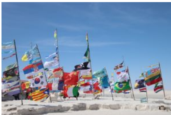
Monumento a las Banderas