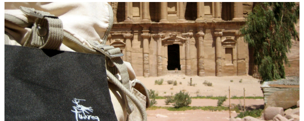
Autor: Margarita garica Gil