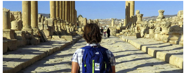
Autor: Susana MURCIANO