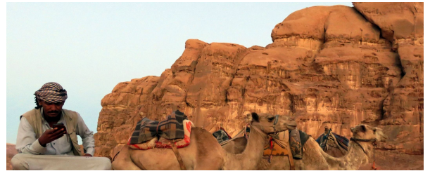
Autor: Susana MURCIANO