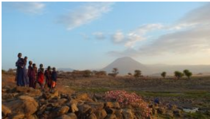
Región lago Natron

El almuerzo de hoy será tipo picnic para poder sacar más provecho al parque ya que por la tarde, con la puesta de sol, regresamos al campamento para descansar y pasar la noche en plena sabana.