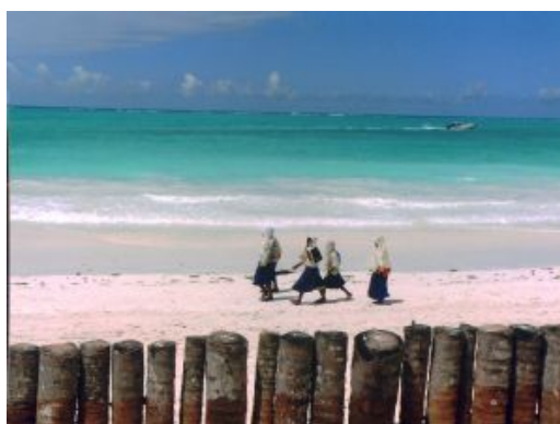
playas de Zanzibar