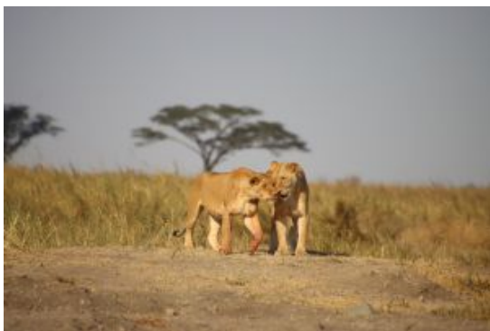
Complicidad en el Serengeti

Por la tarde saldremos del cráter y nos dirigiremos a la localidad de Karatu.