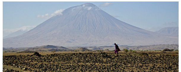
Autor: Aitana Bigorra