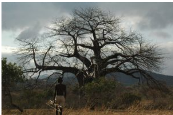
De caza junto al Lago Eyasi

A ultima hora de la tarde saldremos hacia a Arusha, a un alojamiento cercano al aeropuerto, donde podremos descansar hasta la hora de traslado al aeropuerto.