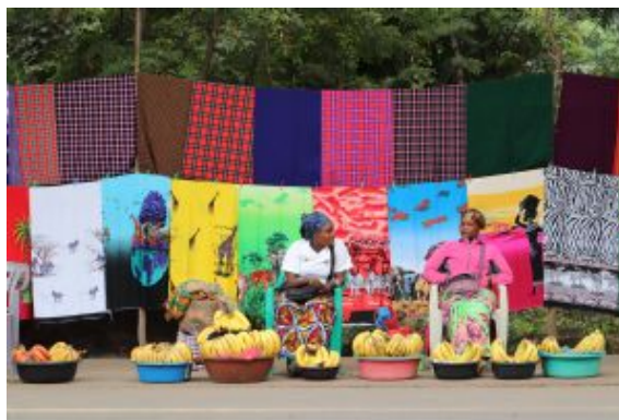
Mercat a Tanzania