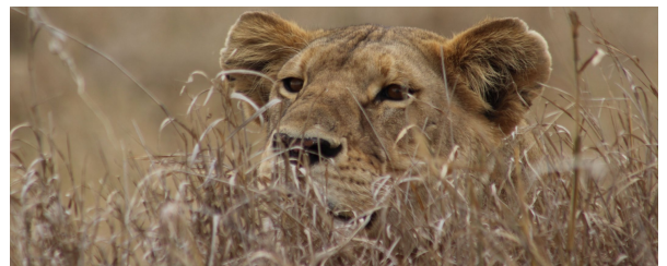
Autor: Begoña Delgado