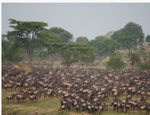
Preparant la gran migració