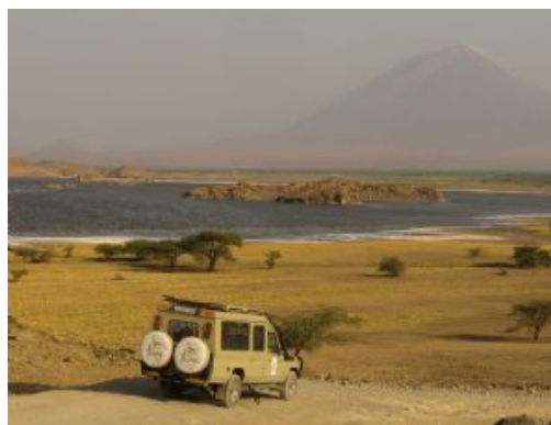
Lago Natron vehiculo