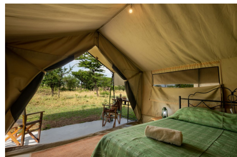
Interior tienda safari en Kati Kati tented Camp