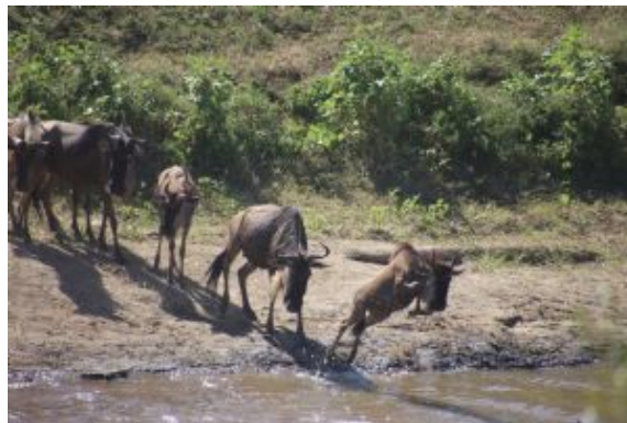
Atravesando el Mara