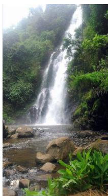
Materuni Falls