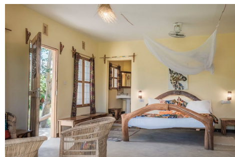
Habitación doble lodge en Natron