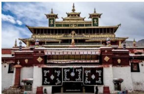
Monasterio de Samye