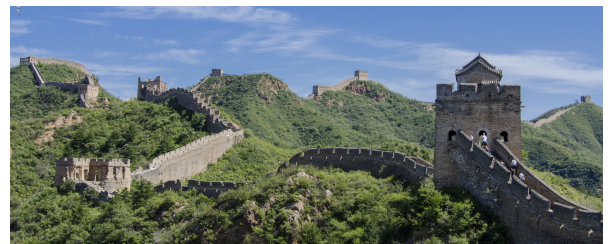
Autor: Alejandro Melian