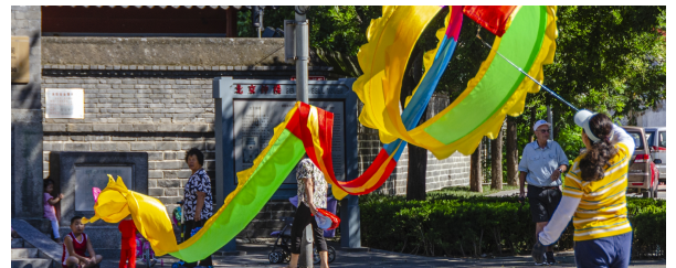
Autor: Alejandro Melian