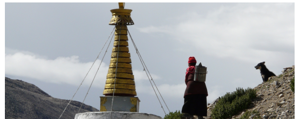
Autor: Montserrat Torra