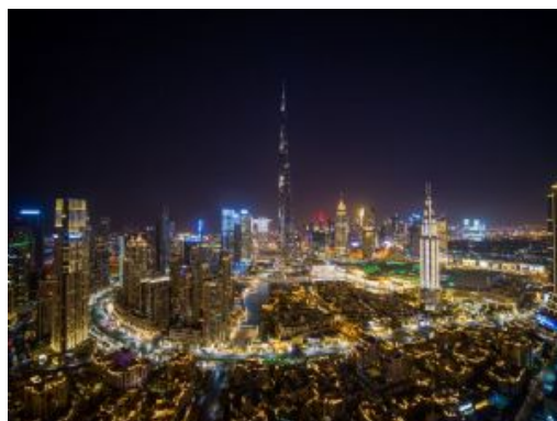
Dubái monumentos 39