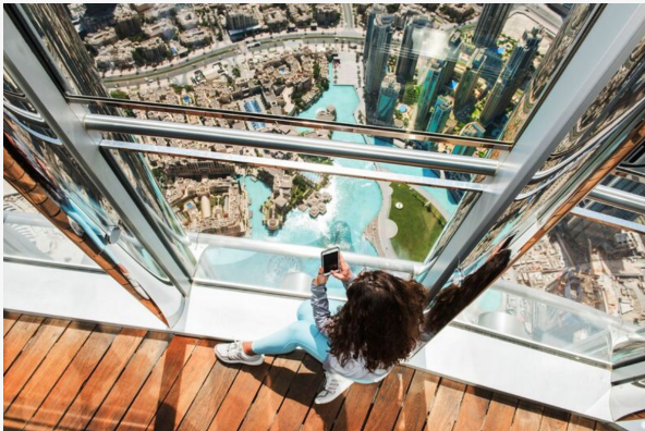
Dubái Burj Khalifa

Consulte precios y disponibilidad para visitas opcionales.