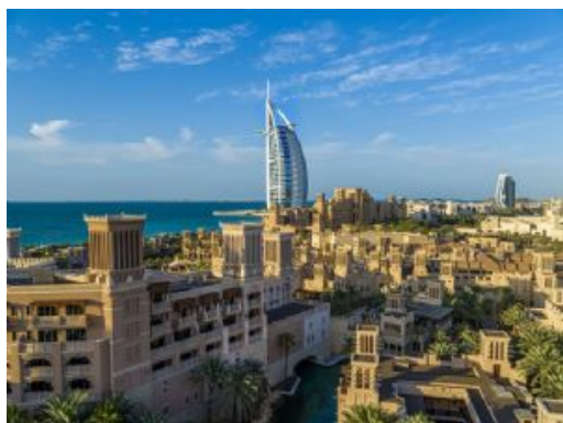
Dubái monumentos 34