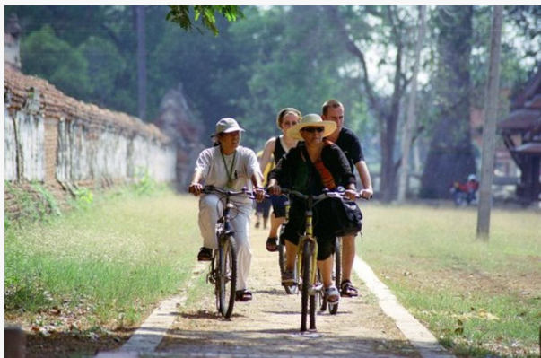
Ayutthaya en bici

Vive una aventura inolvidable con los que más quieres en un tour diseñado para toda la familia donde podréis descubrir la esencia de Tailandia, desde antiguas ciudades y exuberantes parques naturales hasta playas paradisíacas. Disfruta de paseos en tuk-tuk y mercados flotantes. Explora la historia en las majestuosas ruinas de Ayutthaya y Sukhothai. Maravíllate con las cascadas y paisajes del Parque Nacional de Erawan. Relájate en playas de ensueño y disfruta de actividades acuáticas. Vive la vibrante cultura tailandesa en cada rincón del país.