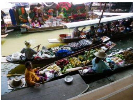
Mercado Damneon Saduak