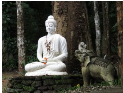
Chiang Mai. Buda