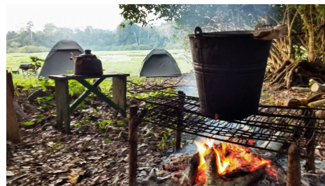
Campamento en la selva