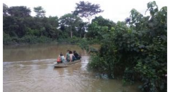
Loango NP_visitas en barca