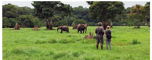
Autor: Gabon Untouched