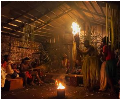
Communicating with the Spirit World Autor: Brad Herman