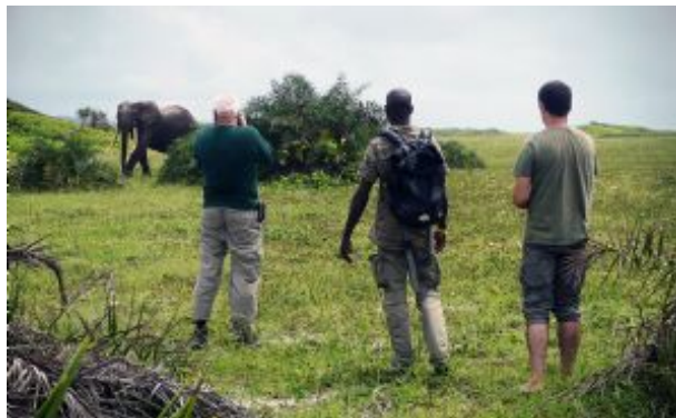
Encuentro con un elefante