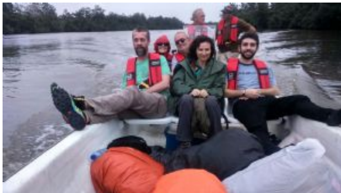
Loango NP_recorrido en barca

La Laguna de Ndogou Formada por mas de 350 islotes, esta laguna de agua oscura y salobre conecta en su desembocadura con la frontera sur del parque Nacional de Loango. Alberga una gran riqueza animal con hipopótamos, manatíes, cocodrilos y peces de agua dulce y salada como la barracuda, el tiburón, tarpon o el capitán, convirtiéndose en una zona de especial interés para la cría de alevines de todas estas especies.