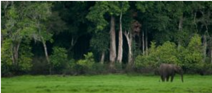
Loango NP_Akaka_elefante en la pradera

Elefantes de Bosque Recientemente ha sido catalogado como un especie diferente al elefante de sabana. Mas pequeño y compacto para adaptarse al ecosistema del bosque, este poderoso herbívoro cuenta con unos colmillos de marfil muy apreciado debido a su color y dureza que la ha sometido a una implacable caza furtiva. Afortunadamente Gabón, gracias a su determinada política de protección de la naturaleza (12% de su territorio protegido en 13 PN y 10 reservas marinas), cuenta con la mayor población de estos animales, estimada en unos 50.000 ejemplares según estimaciones de WCS .