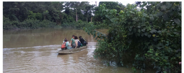
Autor: Gabon Untouched