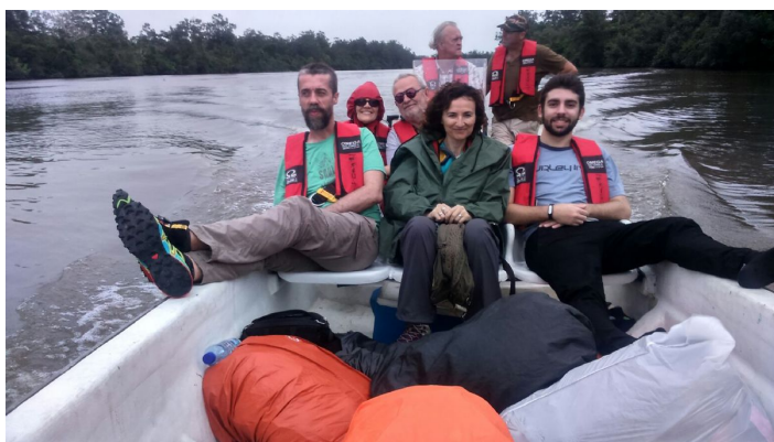
Loango NP_recorrido en barca