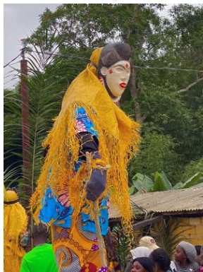
Mascara Mukudji Autor: Gabon Untouched

PN Moukalaba Doudou Este parque, de unos 4500km 2 de extensión, alberga una de las mayores densidades de grandes simios del mundo (gorila de llanura, chimpancé y mandril). Borneado por el gran río Nyanga, surcado por el río Moukalaba y sus afluentes y atravesado por los remotos montes Doudou, cuenta con una gran diversidad de ecosistemas: bosque tropical, manglar, sabana y decenas de kms de costa virgen-semivirgen. Junto con su vecino el PN de Loango crean una de las áreas protegidas más importantes de África central.