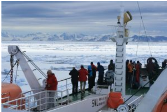
On the watch for polar bears

Como alternativa, navegando por los fiordos secundarios de Bellsund, se puede explorar la tundra donde los renos suelen alimentarse, así como laderas rocosas donde anidan los mérgulos atlánticos, cerca de Vaarsolbukta.