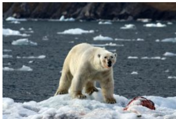
Oso con comida