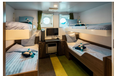
Ortelius cabina cuadruple