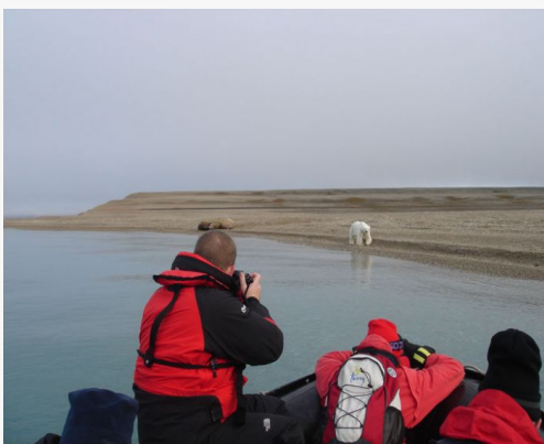
Spitsbergen Oso en la playa

El sol de medianoche es un fenómeno que ocurre durante el verano ártico, cuando el sol es visible durante 24 horas seguidas en condiciones de buen tiempo. El solsticio de verano en Longyearbyen tiene lugar el 21 de junio, cuando el sol alcanza su mayor altura del año sobre el horizonte norte a medianoche. No será hasta finales de agosto cuando el sol vuelva a ponerse completamente, y aun así, solo por unos minutos.