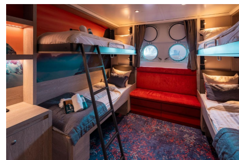
Hondius cabina cuadruple