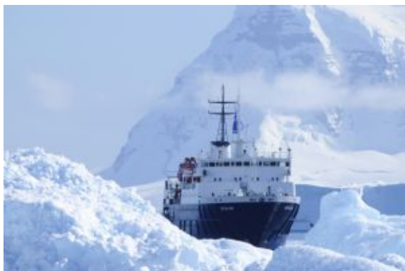
Barco Ortelius 6

Los osos polares habitan esta región, por lo que el barco podría detenerse durante varias horas entre el hielo marino antes de virar de nuevo hacia el oeste. Si esta área se encuentra libre de hielo marino (habitual en agosto) dispondremos de un día adicional en esta área; en caso contrario (habitual en julio) nos dirigimos hacia Sorgfjord, donde tendremos la oportunidad de ver una manada de morsas cerca de las tumbas de los balleneros del siglo XVII en Eolusneset. Un paseo por la naturaleza aquí permite acercarse a familias de lagópodos (o perdiz nival). En el lado opuesto del fiordo, en Heclahamna, también se encuentra un hermoso lugar para realizar excursiones.