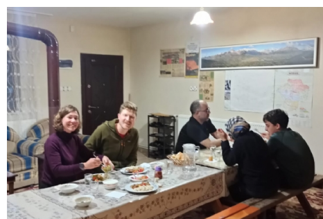
Casa local Taurus