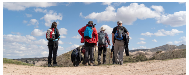
Autor: Tino Valduvico