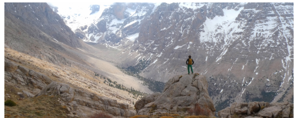
Autor: Archivo Tuareg