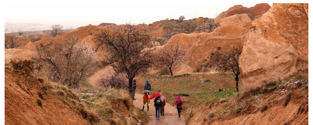
Autor: Tino Valduvico