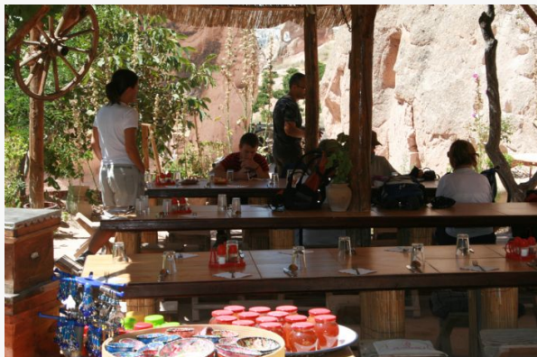
Almuerzo en fonda de Capadocia