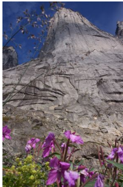
Big Wall