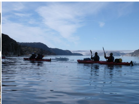
Kayak-Groenlandia