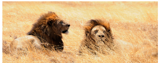
Autor: Bruna Palau