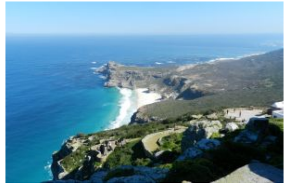
Sudafrica : Cabo de Buena Esperanza