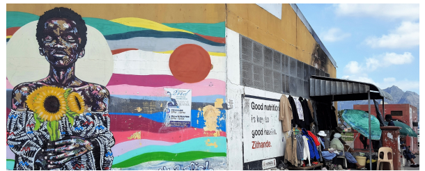
Autor: Natalia Giner