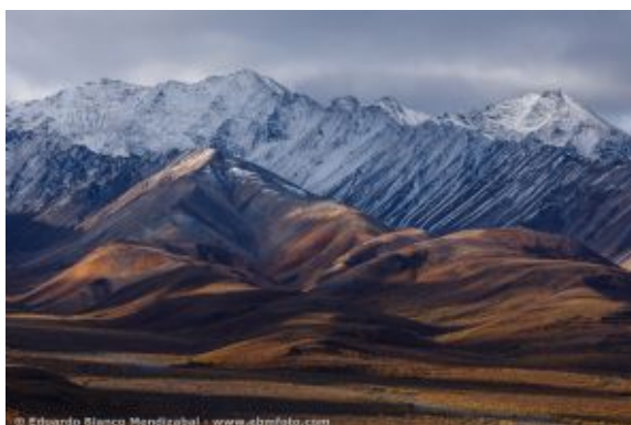
Alaska_Eduardo Blanco_1 10