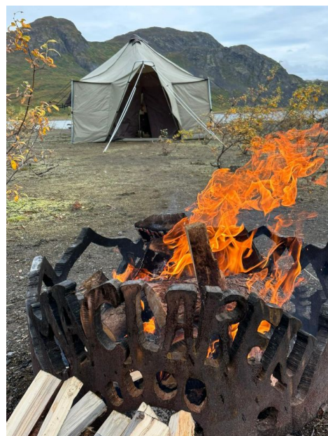
Maclaren river campsite