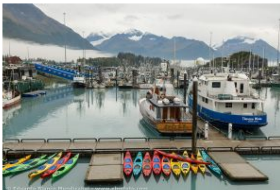
Alaska_Eduardo Blanco_1 1