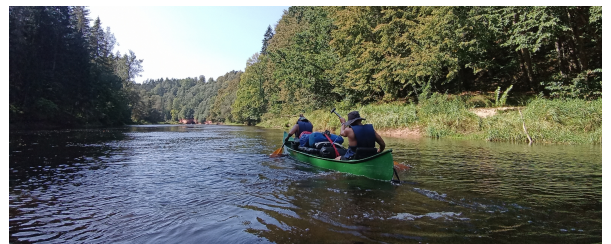
Autor: V. Echazabal