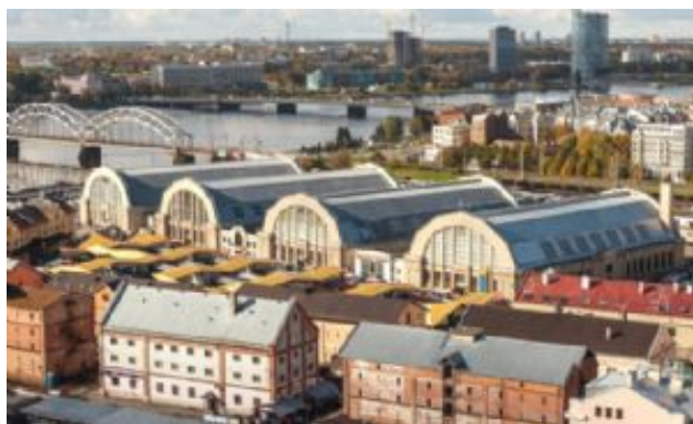
Riga Central Market

Traslado al aeropuerto y fin de nuestra aventura en Letonia.