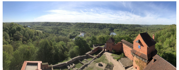
Autor: Pere Mongay