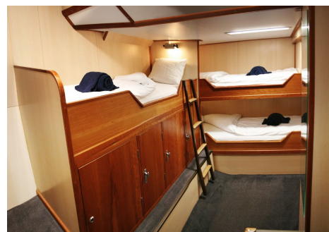
Cabina triple ojo de buey