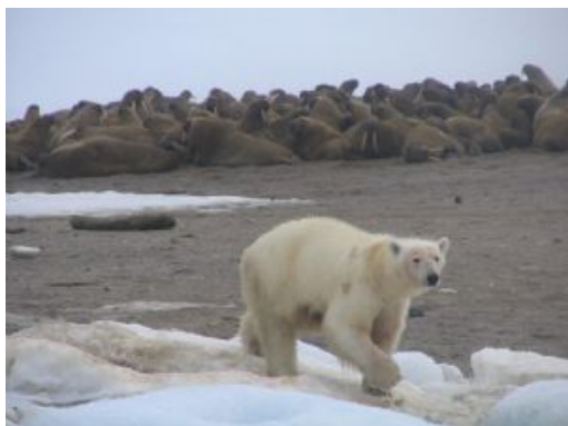
Franz Joseph Land 9