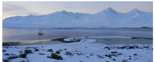
Autor: Ines López