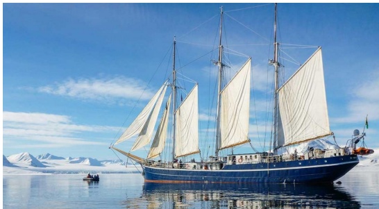
Rembrandt van Rijn