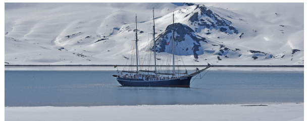
Autor: Peter Hunseler