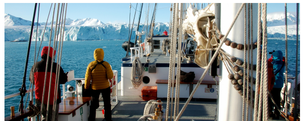
Autor: Philip Schaudy