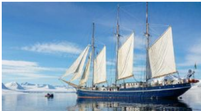
Rembrandt van Rijn

Seguiremos navegando hacia Fuglefjorden. Durante la travesía visitaremos Svitjodbreen y Birgerbukta, ambos sitios reproductivos de págalo grande y lugares probables de avistamiento de oso polar. En Birgerbukta podremos ver hornos balleneros vascos del Siglo XVII que fueron utilizados para cocinar grasa de ballena. El objetivo siguiente será visitar Ytre Norskøya, una pequeña isla que sirvió durante muchos años como un puesto de vigía de balleneros holandeses. Aquí todavía se pueden seguir las huellas de los balleneros hasta la cima de la isla, pasando por populares acantilados de aves en el camino.