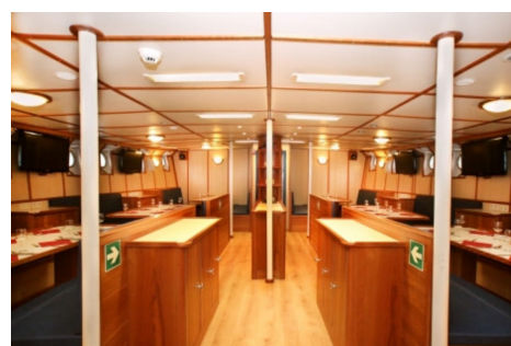
Interior Rembrandt van Rijn