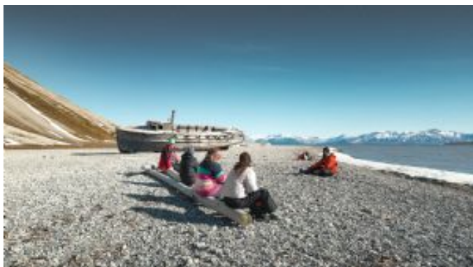
Descansando en las playas de Svalbard