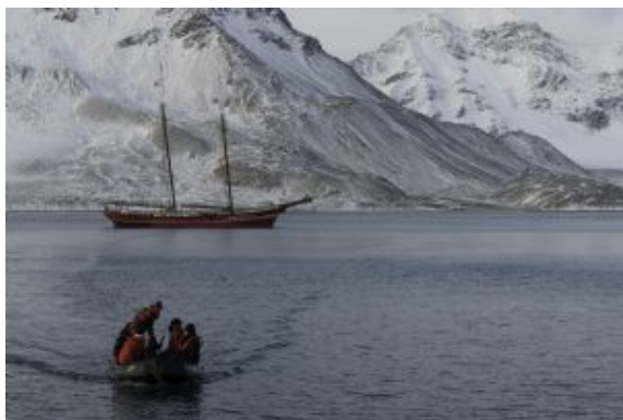
Spitsbergen: Isant les veles del Noorderlicht

Los desembarcos y vistas dependerán de las condiciones locales. Es posible que se pueda realizar una excursión en la península de Blomstrandhalvøya, donde se pueden ver los restos de una mina de mármol en Ny London. Desde este lugar, también se obtienen vistas de Tre Kroner, los tres icónicos picos montañosos que emergen a través de la capa de hielo. Otra opción sería visitar Ny Ålesund, la población más septentrional del planeta, antiguo centro minero ahora convertido en una comunidad científica. Los visitantes interesados en la historia de la exploración ártica podrán llegar hasta el mástil de amarre que utilizaron los exploradores Amundsen y Nobile en los dirigibles "Norge" e "Italia" en 1926 y 1928 respectivamente.