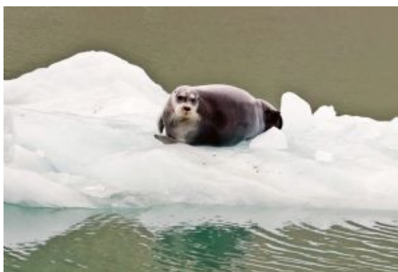
Spitsbergen Fauna marina