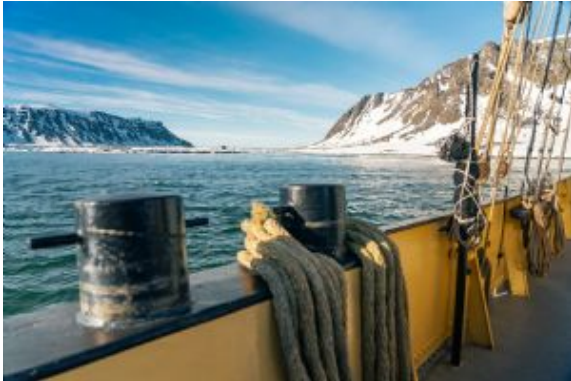
Franz Josef Land 9

El glaciar Esmarkbreen desemboca en la bahía de Ymerbukta, donde organizaremos un desembarco por la mañana. Dependiendo de la disponibilidad de un muelle en Barentsburg, navegaremos hacia el asentamiento minero ruso, donde llegaremos hacia el final de la tarde. Barentsburg es el segundo asentamiento más grande del archipiélago de Svalbard, en su día habitado por más 1000 personas, quedando hoy reducido a unas 400. En el centro del pueblo hay un busto de Lenin de tamaño real, edificios soviéticos de estilo modernista, la cervecería más septentrional del mundo y el museo Pomor.