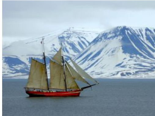
Noorderlicht a vela