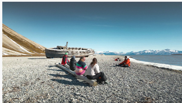
Descansando en las playas de Svalbard