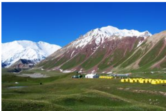
Campo base Achil Tash