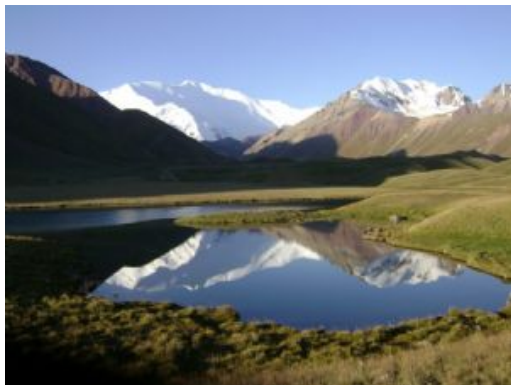
C.B. Achik Tash