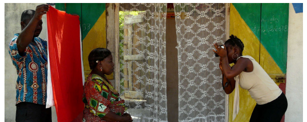
Autor: Iciar Garcia