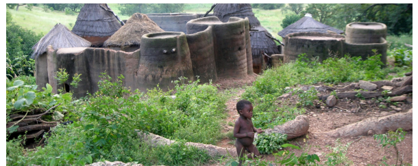
Autor: I Homedes