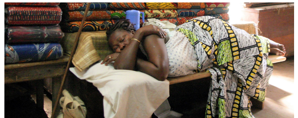
Autor: J Paga