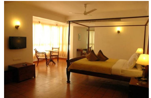
Hotel The Killians