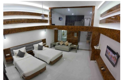
Hotel Grand Bay Hotel