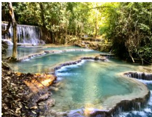
Tat Kuang Si