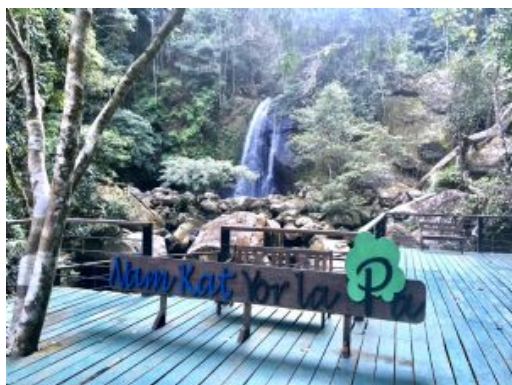
LAOS - NAM KAT 6

Caminata: 2h30min (5km/15min en coche + 2km/2h caminata ida y vuelta + 5km/15min en coche)