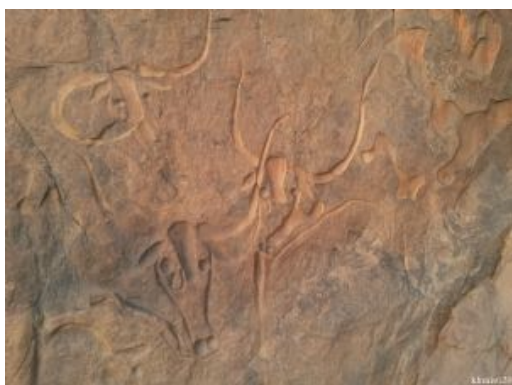
zobeidi mohammed khemisti Foto: Djanet_la vache qui pleure

Recorrido en 4x4 : 5 horas (paradas incluidas)