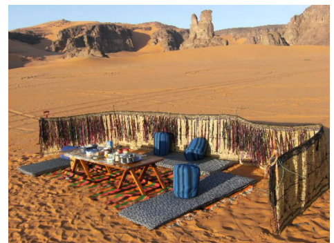
Logística_setting para el picnic

Los traslados en Argel están también incluidos.