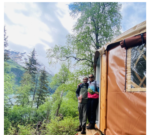
Yurta en Moose Pass

Fairbanks: Bridgewater Hotel o similar. Hotel de 2 estrellas, habitación con baño privado y dos camas queen para compartir con un compañero de viaje del mismo sexo o un acompañante.