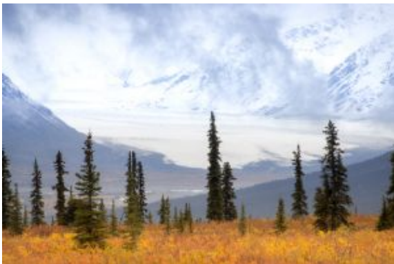
Bosque y hielo

Finalizadas las visitas regreso a Seward.