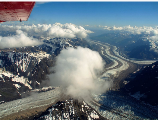
Sobrevuelo en Denali Park

Todas las actividades opcionales deben reservarse con antelación al viaje, excepto las de Anchorage.