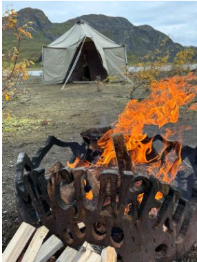
Maclaren river campsite

Todavía quedan restos de lo que fueron las minas de cobre (copper) a pesar de que muchos han olvidado que este fue uno de los últimos sitios hasta dónde llegó la fiebre del oro.