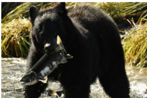
Madre e hijo

Llegada a Anchorage y fin de los servicios.