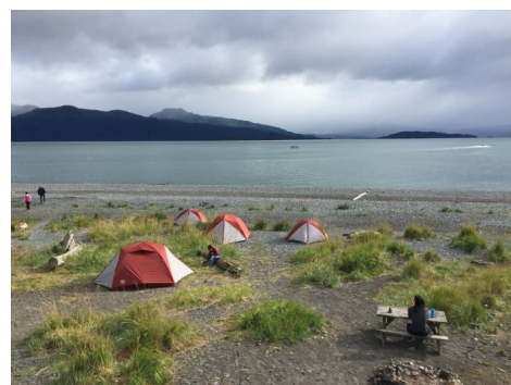
Campamento de tiendas en Homer