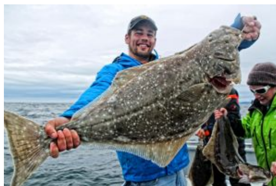
Pesca en Seward