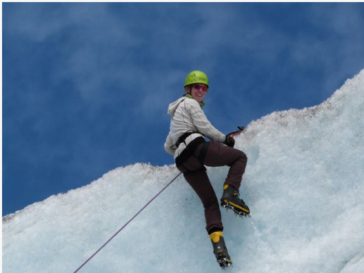
Escalada por el hielo

- Trekking a la Flattop Mountain (con transporte sin guía aprox. $30 USD)