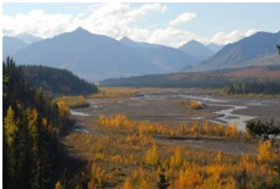
Denali National Park