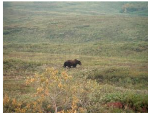
Denali National Park