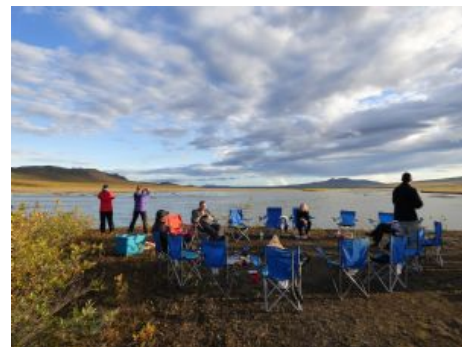
Acampada en Maclaren