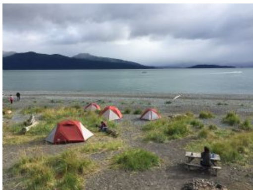
Campamento en Homer