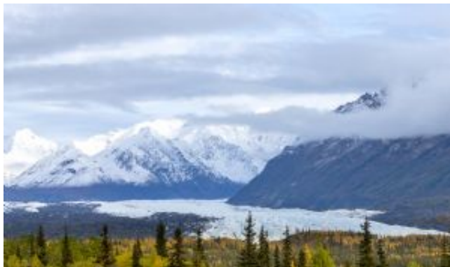
Paisajes de Alaska

Localizada al este de la Península de Kenai y Resurrection Bay, Seward es conocida como la "puerta del Kenai Fjords National Park". A medio día por carretera desde Anchorage, llegaremos al puerto pesquero de Seward. Tarde libre para descubrir el encantador pueblo y su paseo marítimo.