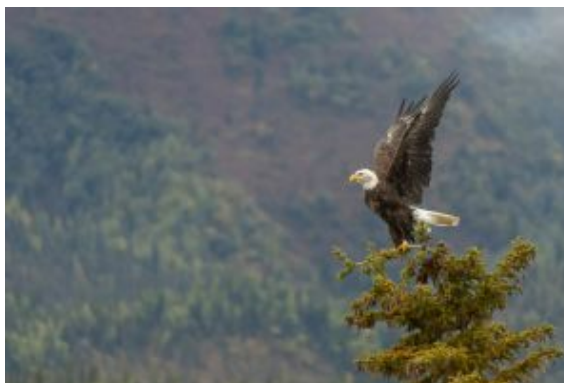
Alazando el vuelo