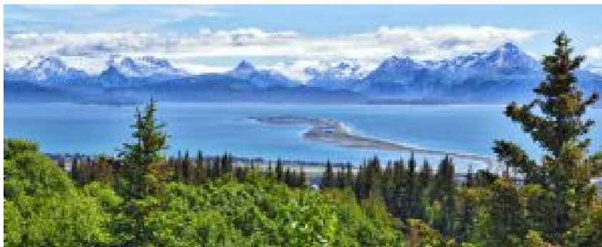
Paisajes de Alaska