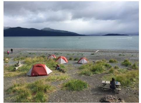
Campamento de tiendas en Homer