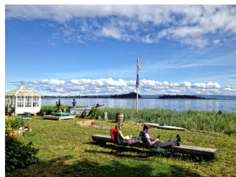
Adventure Camp en Kasitsna Bay