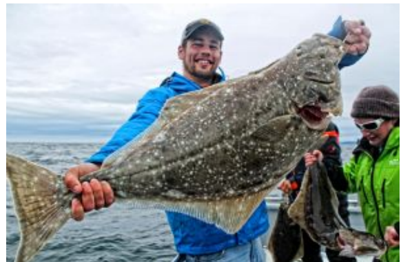
Pesca en Seward