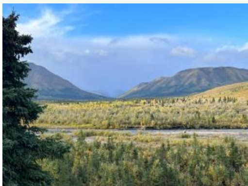
Wrangell St Elias NP

Posibilidad de hacer actividades opcionales como kayak por el Columbia Glacier Sea o el crucero Lulu Belle Wildlife entre enormes icebergs y un maravilloso paisaje