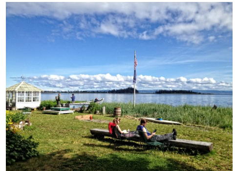
Adventure Camp en Kasitsna Bay