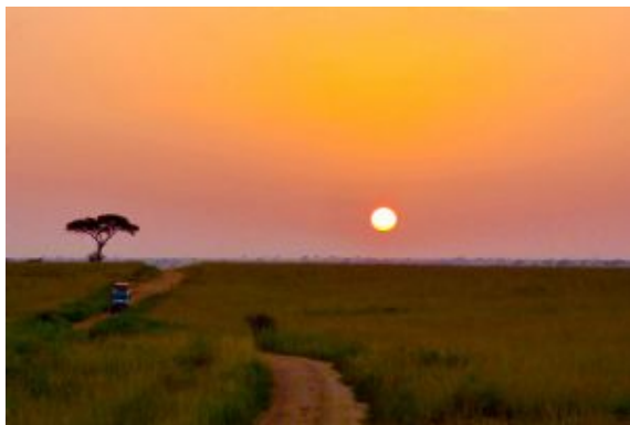
Puesta de sol en Uganda

Tras conexiones intermedias. Llegada a la ciudad de origen y fin del viaje.