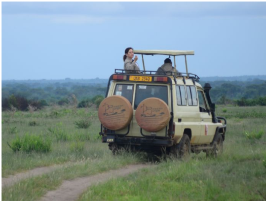
Vehículo 4x4, safari en Uganda