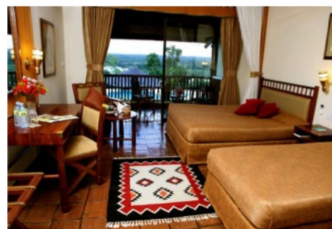
Paraa Safari Lodge, Murchison Falls, opción confort