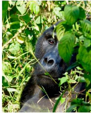
Encuentro con los gorilas de montaña