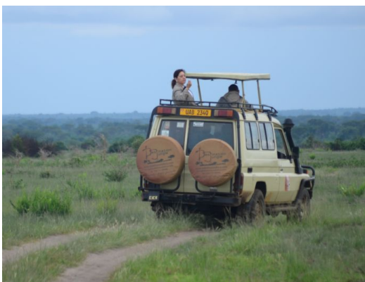
Vehículo 4x4, safari en Uganda