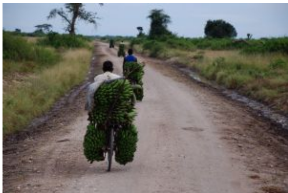
por las carreteras de Uganda

Un paseo de unas dos horas, poco antes del atardecer, en un bote cubierto por su parte superior, sin baño público. Para el avistamiento de fauna la mejor zona es a babor. Equipo: Son muy recomendables los prismáticos. De los 38 km que tiene el canal, se navegará desde el embarcadero de Mweya hasta la salida del canal al lago Eduard y regreso.