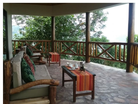
Bwindi Safari Lodge, opción confort