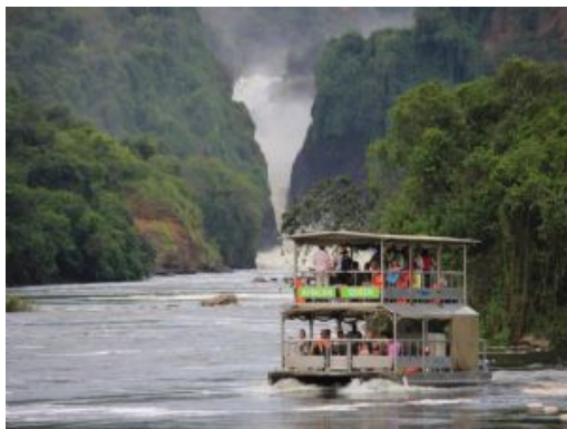
Crucero en Murchison Falls

Trayecto en vehículo: 3 hrs - 180 kms / Caminata: 3 - 4 hrs