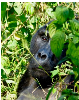
Encuentro con los gorilas de montaña