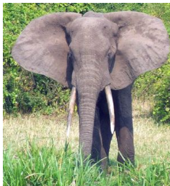
Encuentro con elefante durante el safari