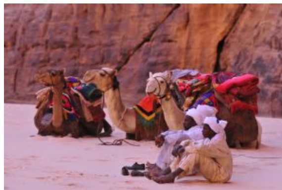
Gente_camelleros y sus camellos