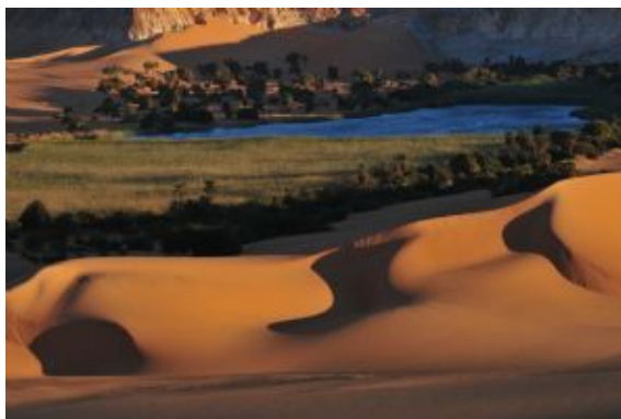
Ennedi_lagos de Ounianga