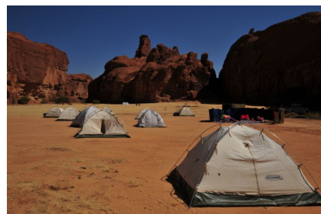
Tiendas para las acampadas