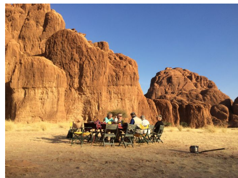
Almuerzo en ruta

Cada dos / tres días se facilita agua para aseo personal (dependiendo de la disponibilidad).