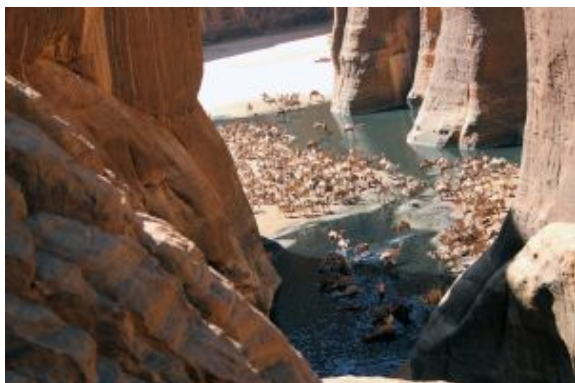
Ennedi_guelta de Archei