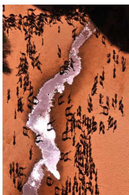
Fauna_camellos junto al guelta

La última jornada nos traerá de regreso a N'Djamena a primera hora de la tarde. Aquí dispondremos de tiempo libre y habitaciones 'day use' en el hotel hasta el momento del traslado al aeropuerto para salir con el vuelo de regreso.