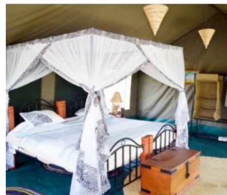
Alojamiento, campamento móvil