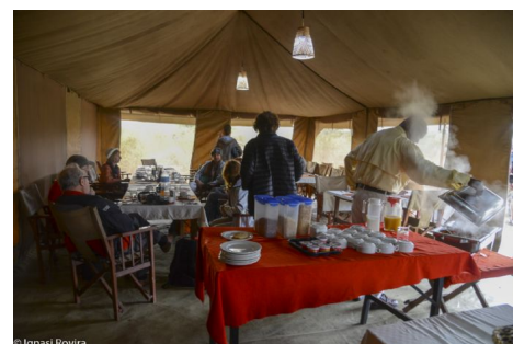
Zona comedor, campamento móvil