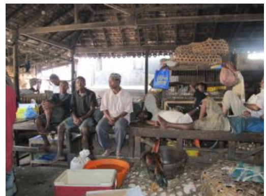
Gente. Poblacion local