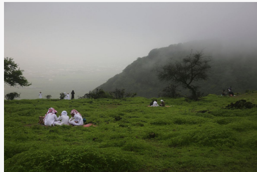
Celebrando el Khareef