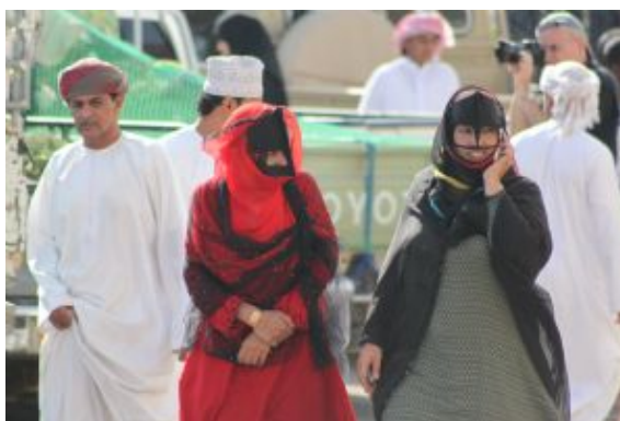
Mercado de Sinaw