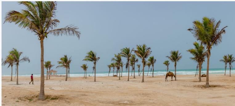
Playas del sur

Y por supuesto, exploraremos Salala, la capital. Esta ciudad costera nos sorprenderá con su vegetación tropical, sus playas de arena blanca y su atmósfera relajada. Aquí encontraremos mercados vibrantes, edificios históricos y una población extremadamente hospitalaria y curiosa con el visitante occidental