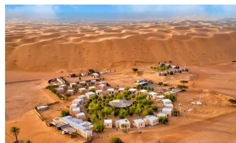
Sama Alwasel Wahiba Sands Camp