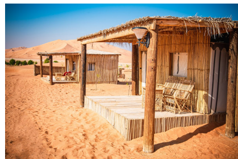
Souly lodge Eco_Camp. Empty quarter