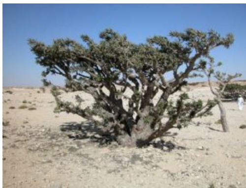
Salalah - Incienso