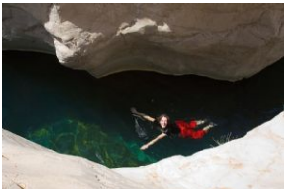
Wadi Bani Khalid