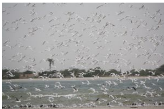
Río Senegal - Reserva Djoudj

Llegaremos por la tarde a Richard Toll, "jardín de Richard", que debe su nombre al hecho que, en la época colonial, en 1822, los franceses habían convertido este sitio en un lugar de ensayo de métodos de cultivo. Descubrimos "la Folie du Baron Roger", un castillo de estilo francés cerrado hoy en día que se encuentra rodeado de construcciones de adobe y arquitectura tradicional de la región. Visita de la ciudad y de la fábrica de caña de azúcar, la CSS (Compañía Azucarera Senegalesa) que se extiende sobre 10.000 hectáreas y es la principal fuente de ingresos de la localidad. Cena y noche a bordo del barco