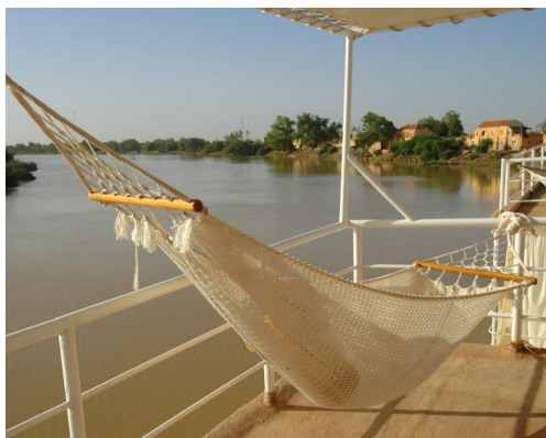
Navegación por el río senegal