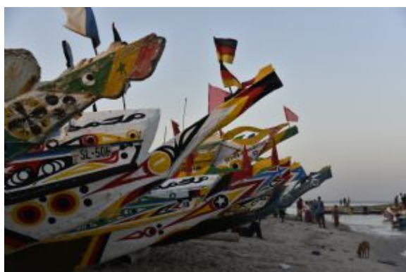
Barques de pesca

En la ciudad colonial de St. Louis se puede admirar la finura de los balcones suspendidos a bellas casas coloniales y seguir el degradado de los colores ocre-amarillo que ofrecen las calles según la posición del sol. El barrio norte de la isla está separado del barrio sur por la Gobernación y la plaza Faidherbe. Siempre sobre la isla encontramos: el Ayuntamiento y el Palacio de Justicia (1ª sentencia en 1875), el hospital (1827) bella construcción ocre-amarilla, el liceo de niñas Ameth Fall que ocupa desde 1927 un antiguo hospital que data de 1840. El famoso puente Faidherbe (500m de longitud) mandado a St Louis en 1897 a raíz de un gigantesco error administrativo. La aldea de los pescadores es interesante por la mañana y a altas horas de la tarde, cuando se ven las enormes barcas. El cementerio musulmán en el barrio Guet Ndar donde las tumbas son estacas recubiertas de redes de pesca. El mercado de Ndar Toute situado en la lengua de Barbarie.