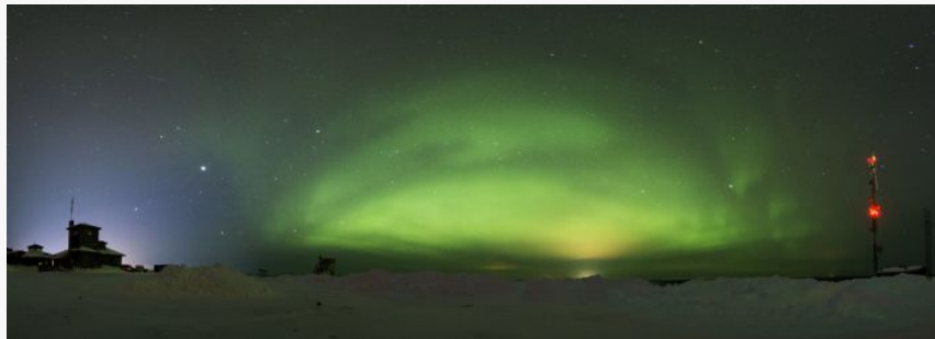
Auroras en Saariselka_95