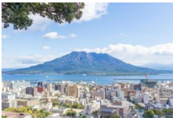
Observatorio de Shiroyama