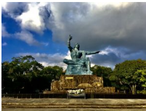
Nagasaki, parc de la pau