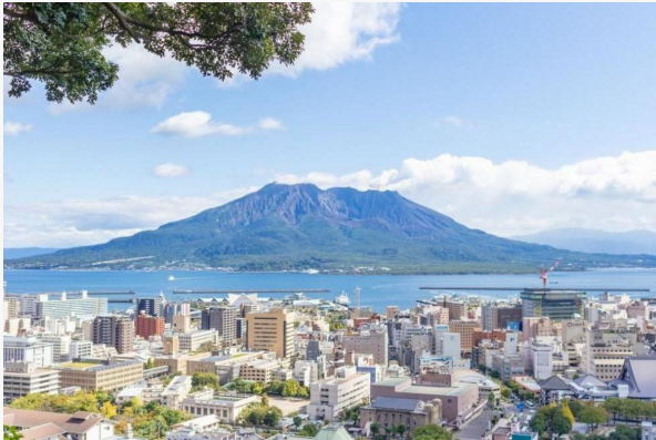
Observatorio de Shiroyama

Notas: Estos precios incluyen medio día de visitas con traslados y guía de habla hispana privados grupo Tuareg. No incluye almuerzo.