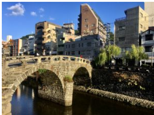
Nagasaki, Megane Bridge

Recomendamos: En esta mañana libre, podemos aprovechar para visitar la histórica isla de Dejima , reconstruida para mostrar cómo vivían los comerciantes holandeses cuando Japón estaba cerrado al mundo. Un lugar perfecto para entender la mezcla cultural única de Nagasaki. Los interesados en los horrores de la guerra, deben visitar el Museo de la Bomba Atómica de Nagasaki que ofrece una visión informativa y solemne del impacto de la bomba atómica Fat Man. También podemos acercarnos a Megane-Bashi el puente de piedra más antiguo de Japón, famoso por su reflejo doble sobre el río Nakashima. Una parada corta, fotogénica y muy céntrica que nos deja muy cerca de algunos de los mejores templos de la ciudad como el Kofuku-ji , uno de los templos más antiguos de la ciudad, vinculado a la comunidad china de Nagasaki y vinculado al budismo obaku o el Sofuku-ji , templo zen de estilo arquitectónico chino, impresionante y diferente al resto de templos japoneses. Tranquilo, fotogénico y con mucha historia. Si no queremos museos ni templos, recomendamos un paseo por el puerto y la zona de Garden Terrace , una zona moderna y muy agradable para caminar, tomar algo junto al mar o disfrutar de vistas al atardecer.