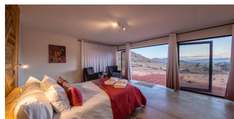
Barkhan Dunes Lodge en Spreetshoogte pass