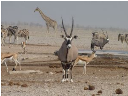
Etosha Parque Nacional

El Parque Nacional de Etosha cubre una superficie de más de 20.000 km cuadrados y alberga a más de 110 especies de mamíferos y 340 de aves. Es una de las reservas y santuarios de animales más importante de África. Miles de animales salvajes viven en esta área, siendo el hogar de 4 de los Big Five: elefante, león, leopardo y rinoceronte. Los abrevaderos del parque abastecen una gran variedad de mamíferos y aves, incluyendo especies como el Impala de cara negra, el guepardo, y el antílope más pequeño de Namibia, el Damara dik-dik.