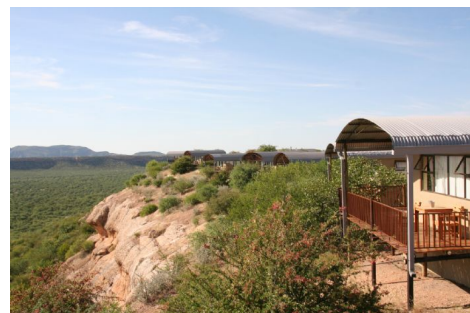
Ugab Terrace Lodge en Khorixas