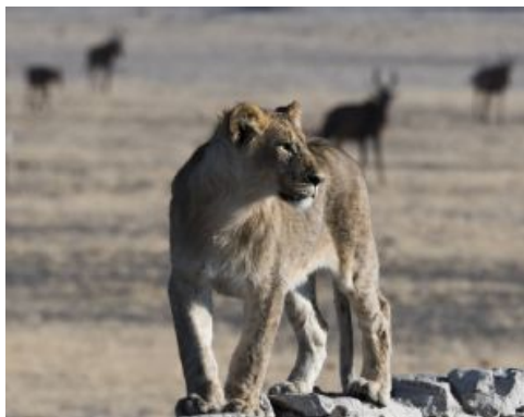
Animales en etosha: león