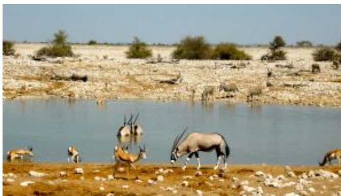
Etosha Parque Nacional