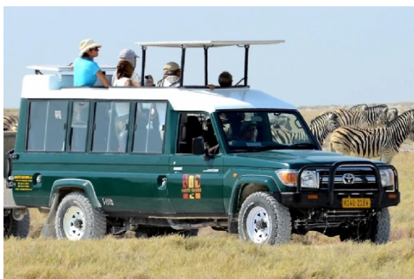
Toyota Land Cruiser