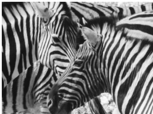
Cebras en Etosha

Trayecto: +/- 250 kms. a lo largo del día