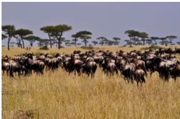
Manadas de ñus

Masai Mara es el hogar de los míticos cinco grandes, el león, el elefante y el búfalo, más el esquivo y solitario leopardo y el diezmado rinoceronte. Pero también es tierra de una de las tribus más poderosas de África, los orgullosos y admirados masais. Mara es el escenario anual de la “gran migración”. En ningún lugar del mundo hay un movimiento de animales tan grande como la migración de los ñus, más de dos millones de animales migran desde el Parque Nacional Serengeti a los pastos más verdes de Masai Mara entre julio y octubre.