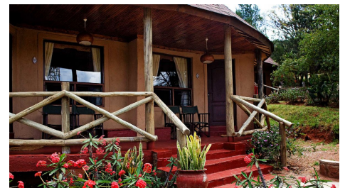
Masai Mara Sopa Lodge