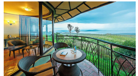
Lake Nakuru Sopa Lodge