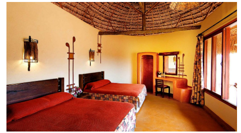
Samburu Sopa Lodge