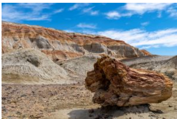
Parque nacional Bosque Petrificado

Trayecto en vehículo: Comodoro Rivadavia-Bosque Petrificado 159km -2 h/ Bosque Petrificado-Los Antiguos 335km - 4h.