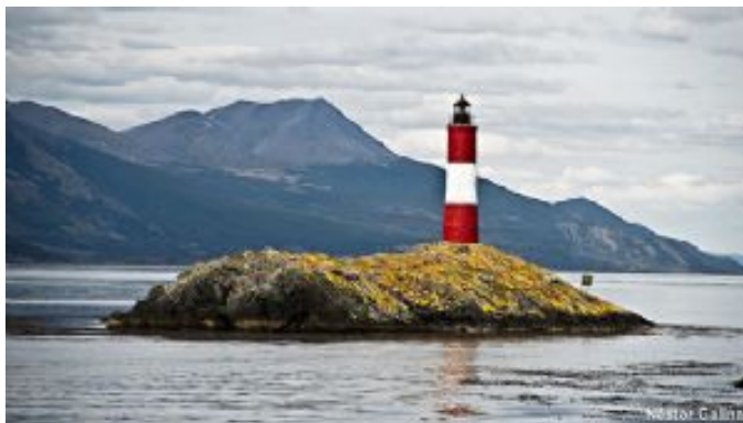
Canal de Beagle