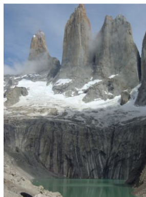
Yolanda Guzmán Foto: Torres del Paine