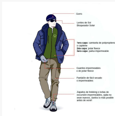
Equipo recomendado Trekking