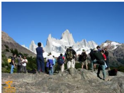
Fitz Roy_P.N_Los Glaciares_El Chalten

Los pasajeros que prefieran no participar en esta caminata tendrán el día libre para excursiones o actividades alternativas (no incluidas)