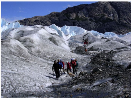
Trekking hacia la base del circo del Cerro Fitz Roy