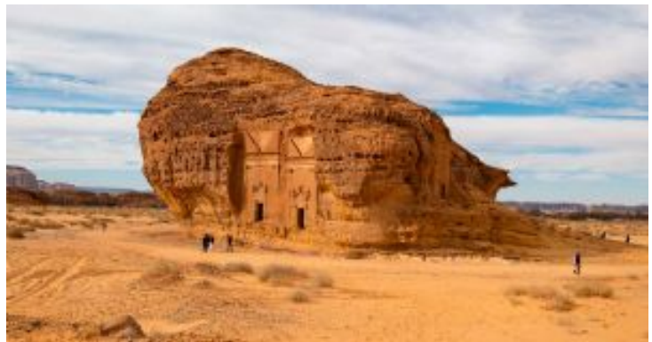
Al Ula - Hegra 24