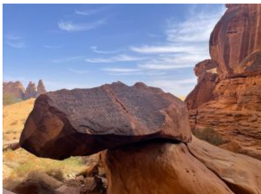
Biblioteca al aire libre de Djebel Ikma