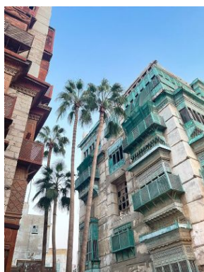
Al Balad - Jeddah

Por la tarde recorreremos de Al Balad, el barrio antiguo de Yeda, con sus edificios históricos. Aquí se proveían de víveres los antiguos peregrinos en su camino a la Meca. Finalizaremos el día visitando la Fuente del rey Fahd, una vista impresionante al anochecer, cuando se ilumina y el chorro de agua alcanza una altura de 260 m (récord Guinness). Alojamiento en Jeddah.