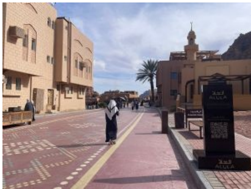
Al Ula Old Town