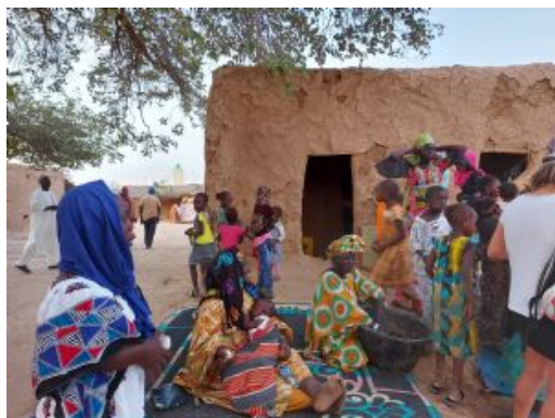
Aldea en ruta