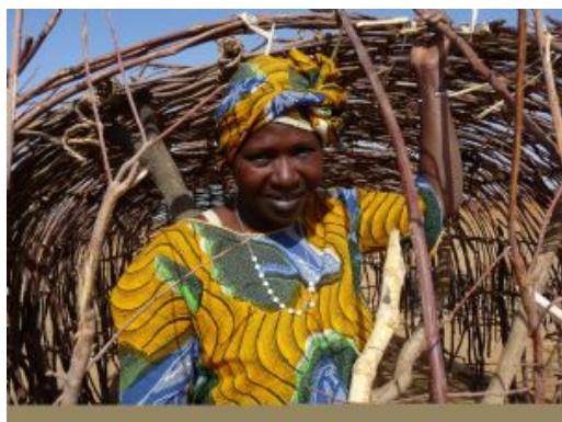
Aldea en ruta a Tambacounda