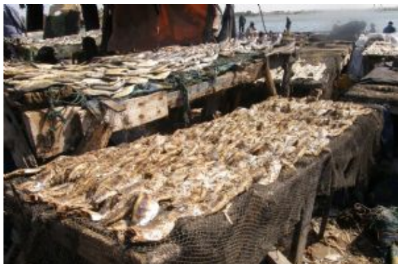
Puestos de pescado

Tiempo libre hasta la hora indicada para el traslado al aeropuerto y fin de los servicios.