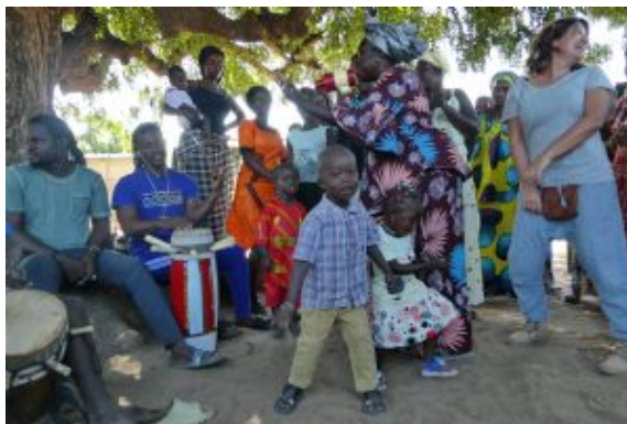
Los mejores tambien bailan