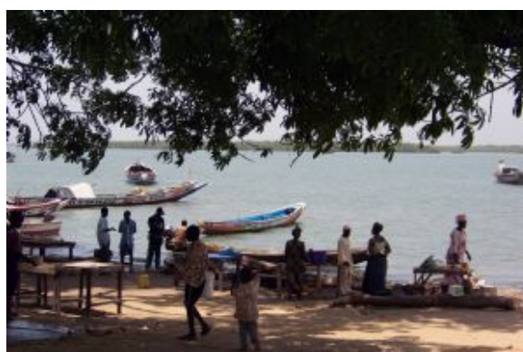
Mercado a la orilla del mar