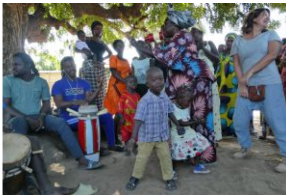
Los mejores tambien bailan