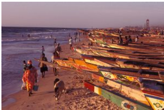
Piraguas en la playa

Tiempo libre hasta la hora indicada para el traslado al aeropuerto y fin de los servicios.