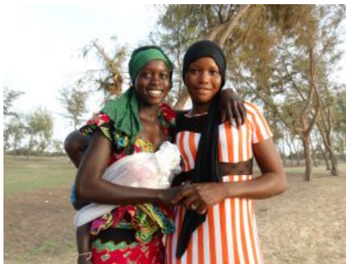
Mujeres en Saly