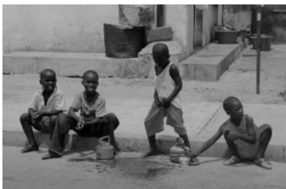
Niños en Dakar

Trayecto en ferry: 30´ por viaje// Trayecto por carretera: 35km/1.15h