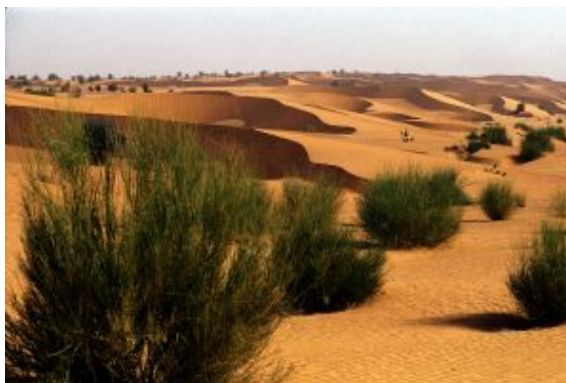
Dunas desierto Lompoul