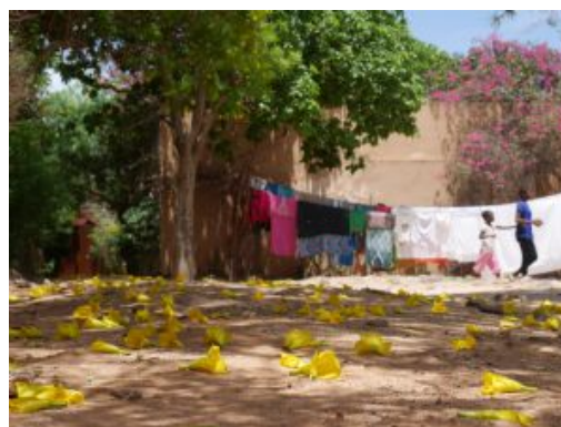
Isla de Gorée