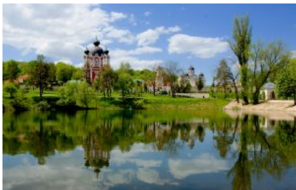
Monasterio de Curchi

Traslado al aeropuerto de Chisináu para el vuelo de regreso.