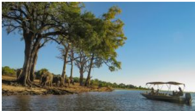
Chobe Safari Cruise