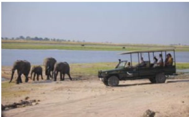
Safari en Chobe

Cuando se pone el sol el cielo y el agua se tiñen de colores anaranjados, rojizos y morados, creando un espectáculo visual único.