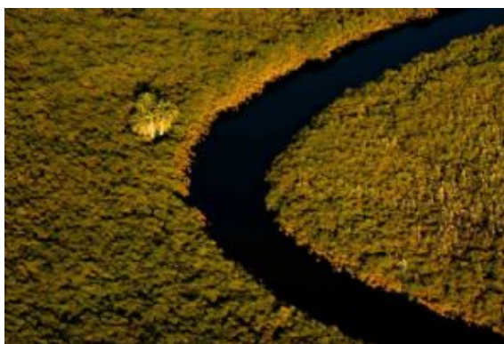
Canales del Delta del Okavango