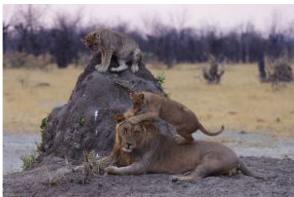
leones en Savute

Entre octubre y noviembre destacan las migraciones de cebras desde Magkadikgadi, cuando los pastos del sur se agotan.