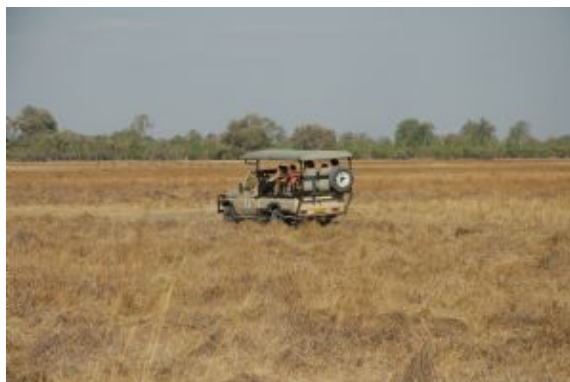
De safari por el norte de Botswana