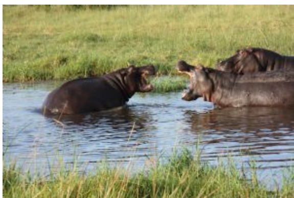
Pelea de hipopótamos

Continuación en vehículo a nuestro lodge. Cena y alojamiento.