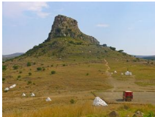
KwaZulu Natal battlefields