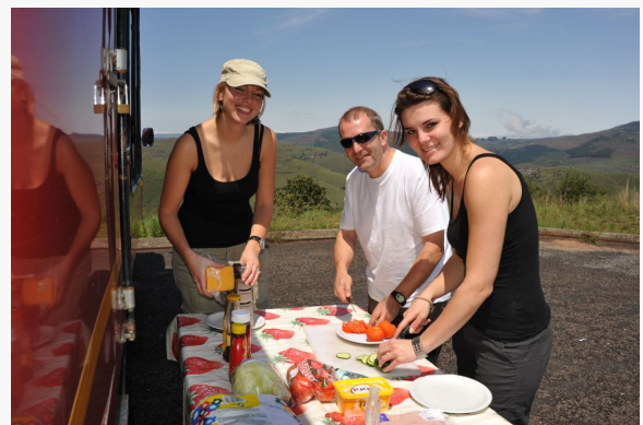
Preparando el almuerzo