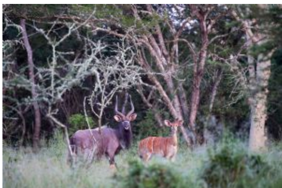
Antílope Nyala en Zululand

Caminata: Sencilla, de 2 a 3 horas por caminos marcados a lo largo del río Msinene.