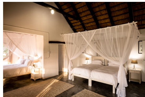
Makuwa Safari Lodge