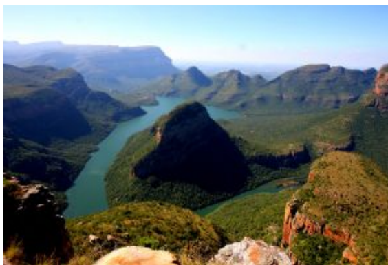
Blyde River Canyon