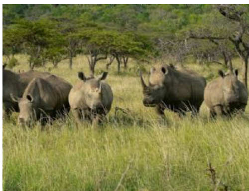
Rinocerontes en Hluhluwe