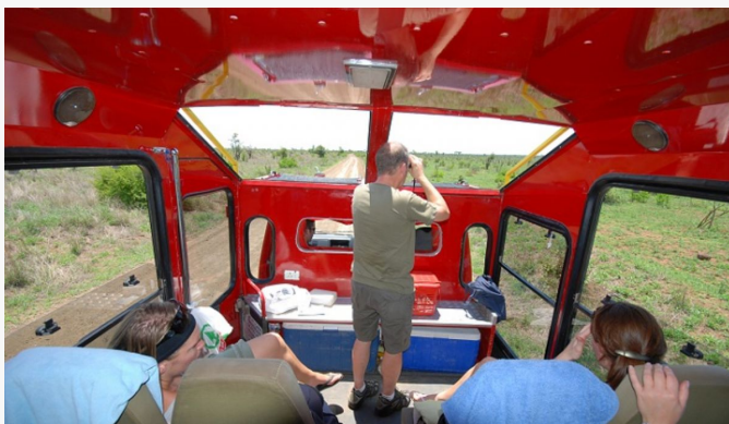
Interior del camión adaptado

Una parte esencial del safari es la participación. Aunque no se trata de un viaje de acampada, se espera colaboración de los viajeros para el mejor funcionamiento de la expedición: desde llevar tu propio equipaje, hasta cargar el camión por la mañana. ¡La participación del grupo forma parte de la aventura!