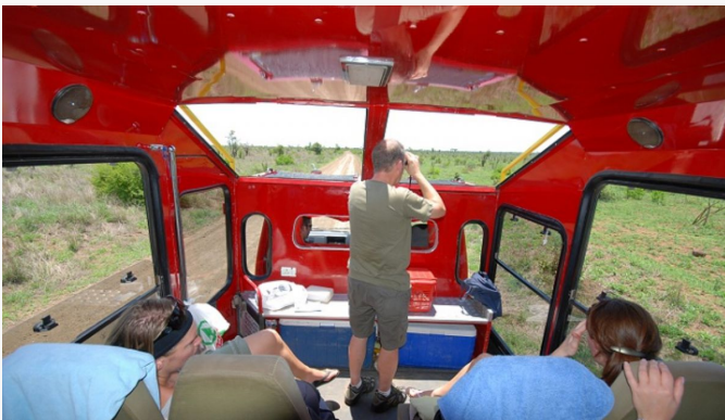
Interior del camión adaptado

Una parte esencial del safari es la participación. Aunque no se trata de un viaje de acampada, se espera colaboración de los viajeros para el mejor funcionamiento de la expedición: desde llevar tu propio equipaje, hasta cargar el camión por la mañana. ¡La participación del grupo forma parte de la aventura!