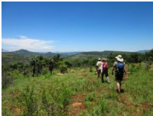
KwaZulu Natal battlefields

Caminata: Exigente, de 4 a 5 horas por caminos irregulares y con desnivel. La caminata completa queda sujeta al nivel del río Buffalo.