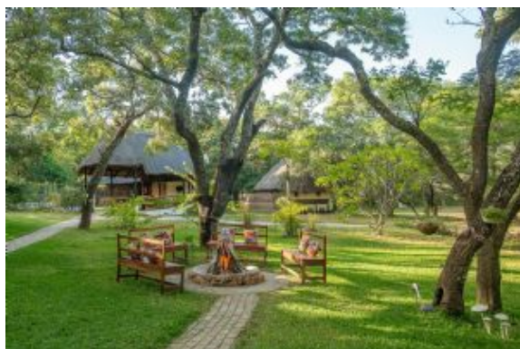
Pioneer Camp en Lusaka

Distancia/Tiempo estimado: ±170km, 3h30 de conducción, sin contar paradas para descansar o visitas