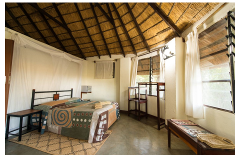
Chalets en Wildlife Camp, Sotuh Luangwa, Zambia,