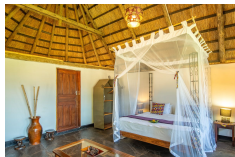
Pioneer Camp, Lusaka