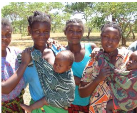
Poblacion en ruta por Zambia