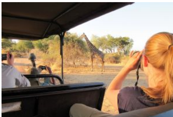
Jirafa, South Luangwa