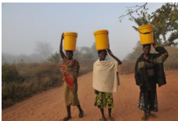
en ruta por Zambia