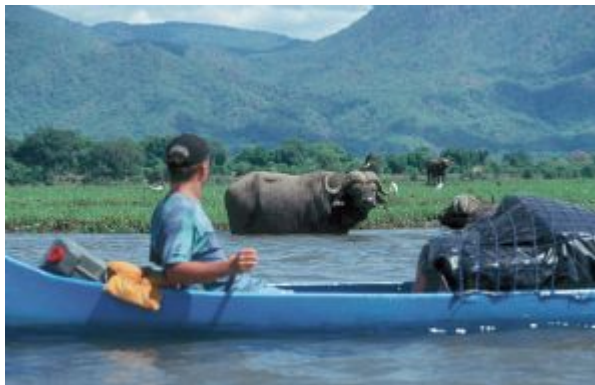
Canoa por el Zambeze