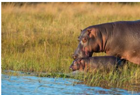
Parque Nacional Liwonde