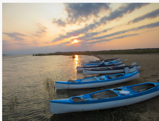
Canoas en el lower Zambezi