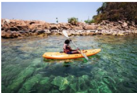
Blue Zebra Island Lodge