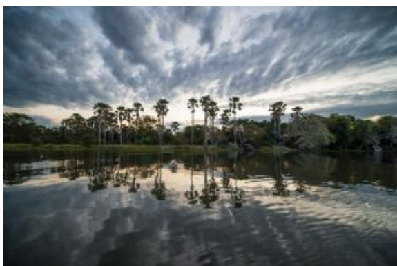
Parque Nacional Liwonde

Por la mañana, exploraremos los hábitats de praderas y bosques en busca de leopardos, elefantes, hipopótamos, antílopes y los raros agapornis de Lilian en nuestro camión de safari. El río Shire fluye a lo largo de la frontera occidental de Liwonde, y embarcaremos en un safari en crucero por el río con la esperanza de encontrar hipopótamos, cocodrilos, elefantes u otros animales que se acerquen a saciar su sed.