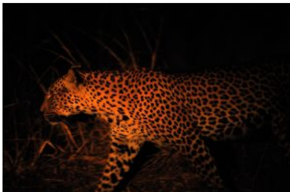
Safari nocturno en South Luangwa

Distancia/Tiempo de conducción: ±370km, 6h30 exceptuando cruce de fronteras, paradas para descansar o comer.