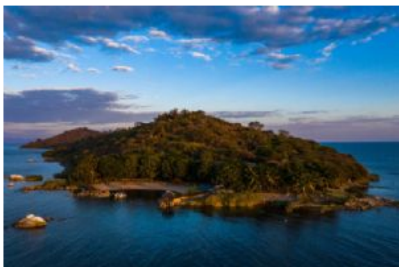
Blue Zebra Lodge

Podremos disfrutar en la playa de una mañana de sol y relax, tomar un kayak para remar alrededor de la isla o hacer snorkel paraver la increíble variedad de peces de colores del lugar.