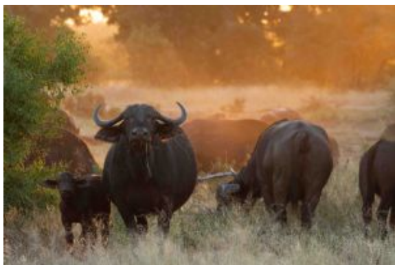
Safari en Kruger