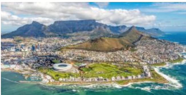
Vista aérea de Ciudad del Cabo

Llegada a Cape Town. Después de los trámites documentales y recogida de equipaje, encuentro con nuestro representante local para traslado al alojamiento. Llegada al alojamiento, check-in y resto de día libre a disposición para empezar a conocer la "Ciudad Madre", probablemente la ciudad con más carácter europeo de todo el país.