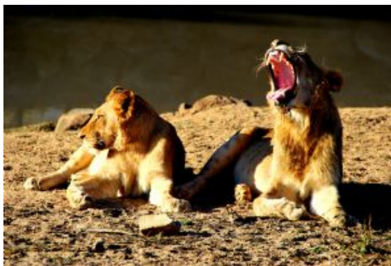
Leones en el área de Kruger