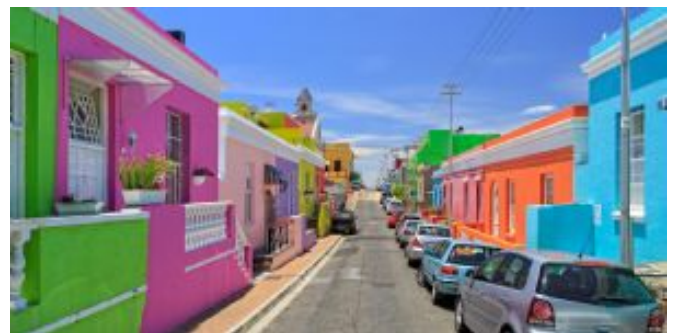
Barrio de Bo-Kaap