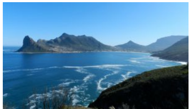
Cape Town. Cape Point NP.