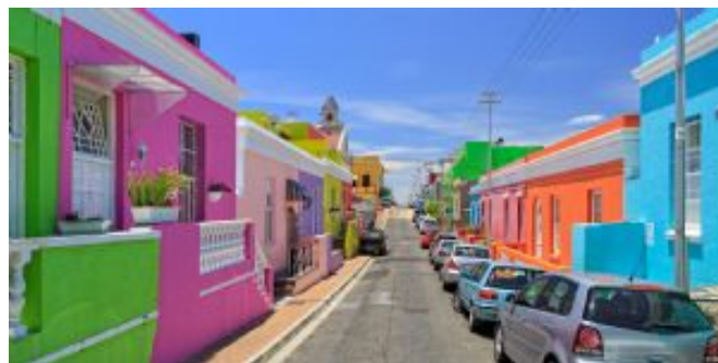
Barrio de Bo-Kaap