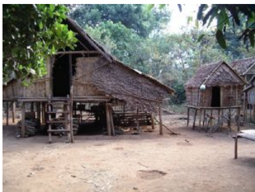
Poblados de Ratanakiri

El itinerario puede cambiar si las condiciones operativas tales como problemas en el itinerario ya sea por inundaciones o sequía en los ríos lo hicieran necesario. En tal caso buscaremos un itinerario alternativo lo más parecido posible al itinerario original.