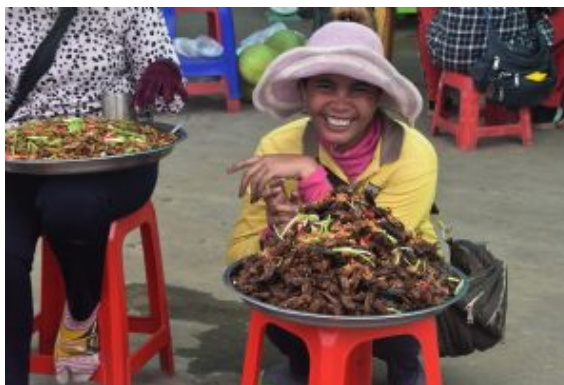
Vendiendo bichos con una sonrisa