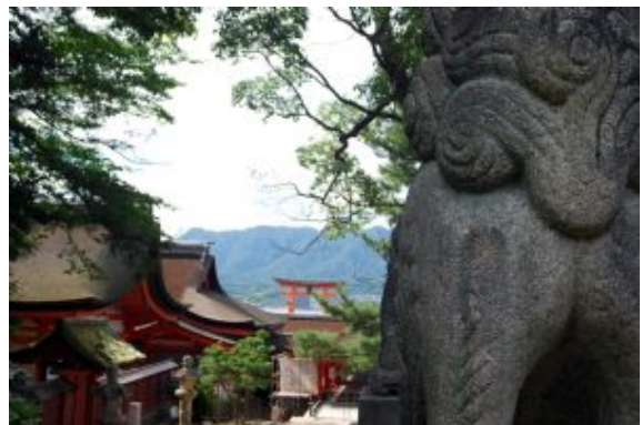
Miyajima - Monte Misen - trekking - caminata 1