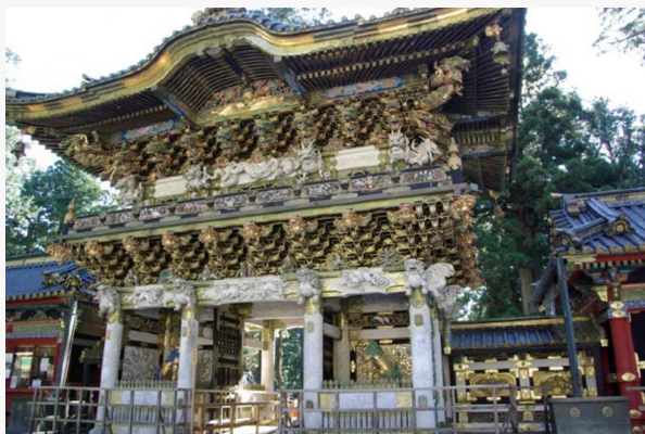
Nikko. Templo Toshogu

Notas: Estos precios incluyen medio día de visitas con traslados y guía de habla hispana privados grupo Tuareg. No incluye almuerzo.