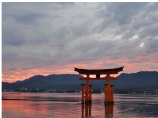
Torii de la isla de Miyajima en la bahía de Hiroshima

A las 07:30 am dejaremos preparadas nuestras maletas para que sean trasladadas a Osaka. Debemos prever una pequeña bolsa con lo necesario para 1 día.