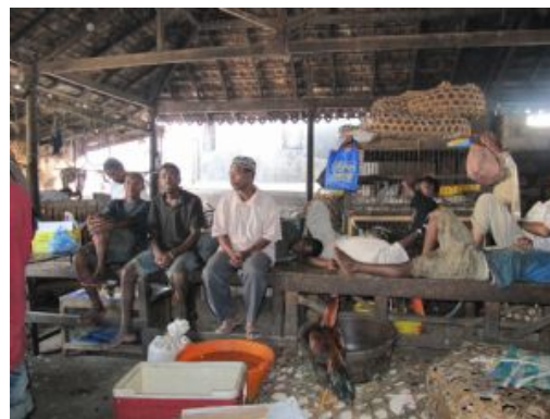
Mercado de Mto Wa Mbu