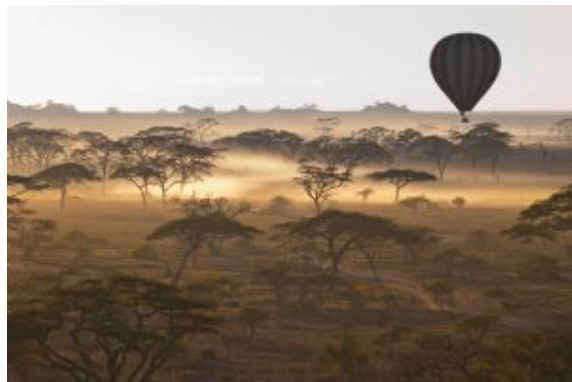
Llanuras de Serengeti