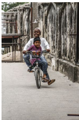
Stone Town

Tras conexiones intermedias, llegada a la ciudad de origen y fin del viaje.