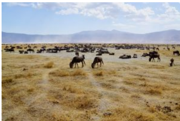
Dentro del Cráter del Ngorongoro

Finalizado las visitas dirigiremos al aeropuerto para tomar el vuelo de regreso. Noche a bordo.