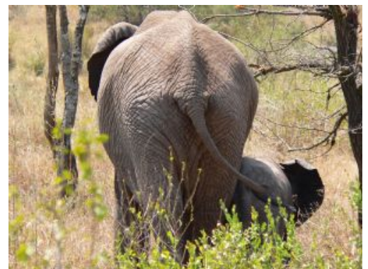
Encuentro con Elefantes