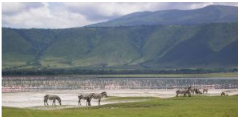
Tarangire, Silale Swamps

Parque conocido por su impresionante concentración de elefantes, majestuosos baobabs y rica biodiversidad a lo largo del río Tarangire que actúa como una fuente vital de agua para la fauna durante la estación seca. Además de elefantes, es el hogar de leones, jirafas, cebras, ñus, búfalos y una increíble variedad de aves.