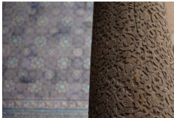
Detall columna Khiva